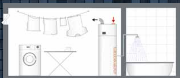
BEISPIEL B (Type Europa Mini IWP, 303 DKL und 323 DK)