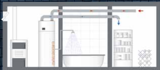
BEISPIEL A (Type Europa Mini IWP, 303 DKL und 323 DK)