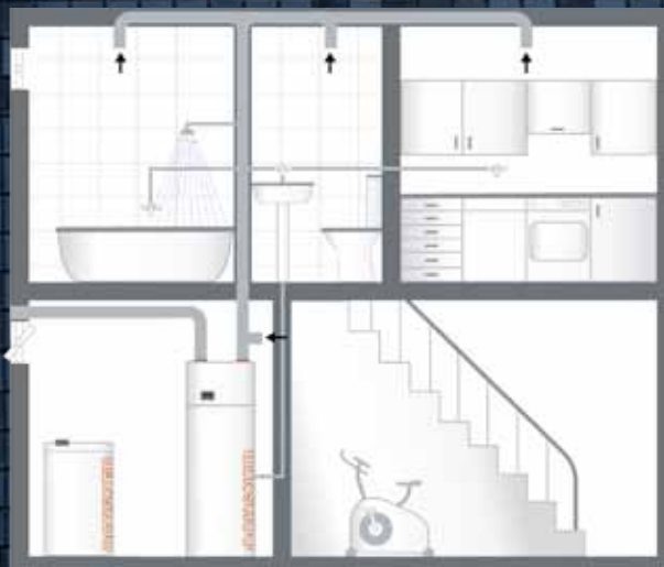
BEISPIEL C (Type Europa 323 DK)