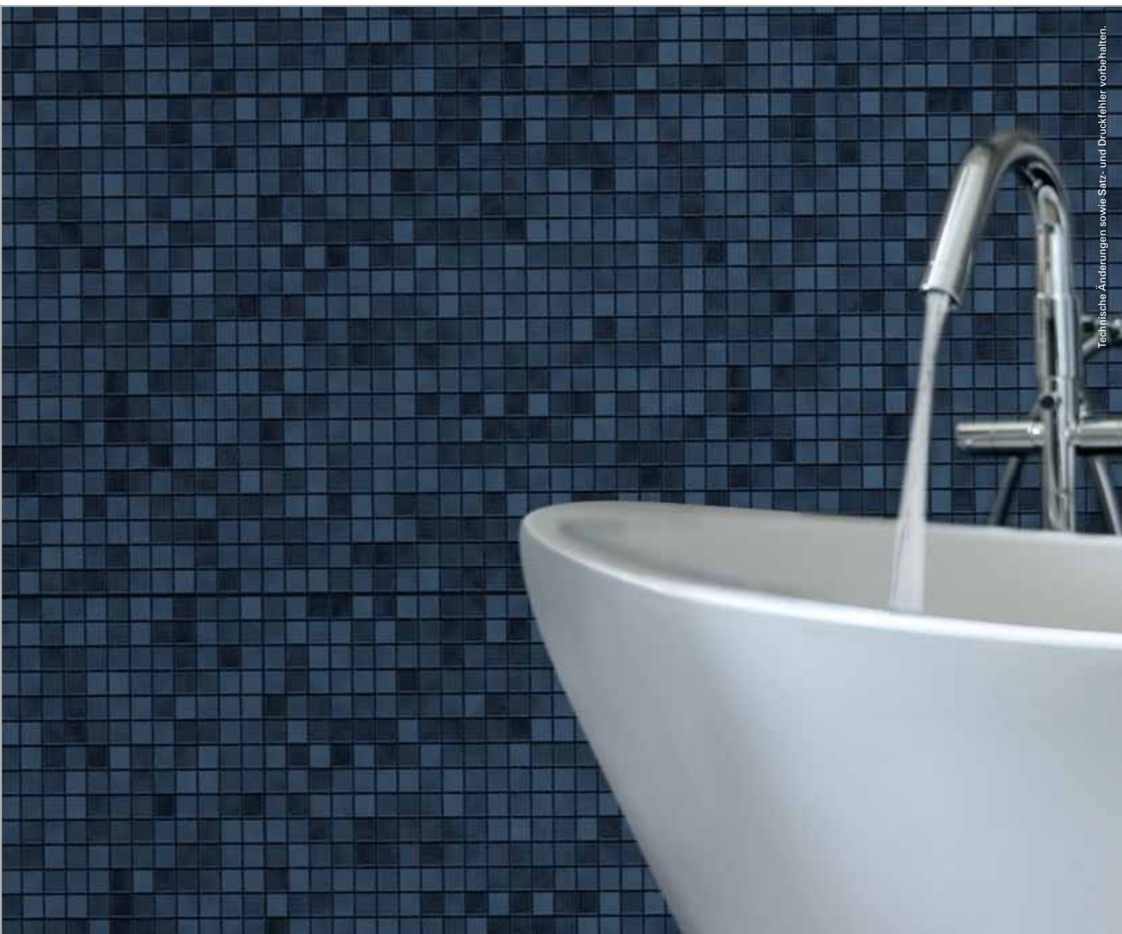
Technische Änderungen sowie Satz- und Druckfehler vorbehalten.